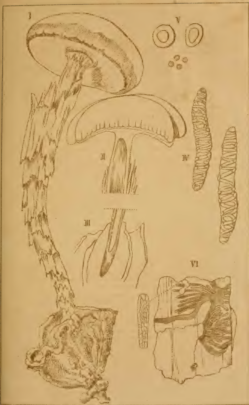
I-V. BATTARRAEA GUICCIARDINIANA , Ces. VI. RHIZOMORPHA SIGILLARIA , Lesq.